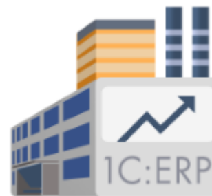
1С:ERP Управление предприятием

Список тем с использованием прикладных решений 1С: